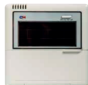
Vezetékes vezérlő CES0-24/E