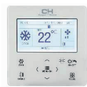
Vezetékes vezérlő XK76