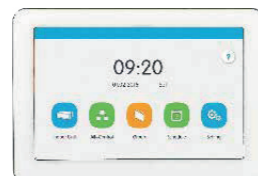
Vezetékes vezérlő CES2-24/F